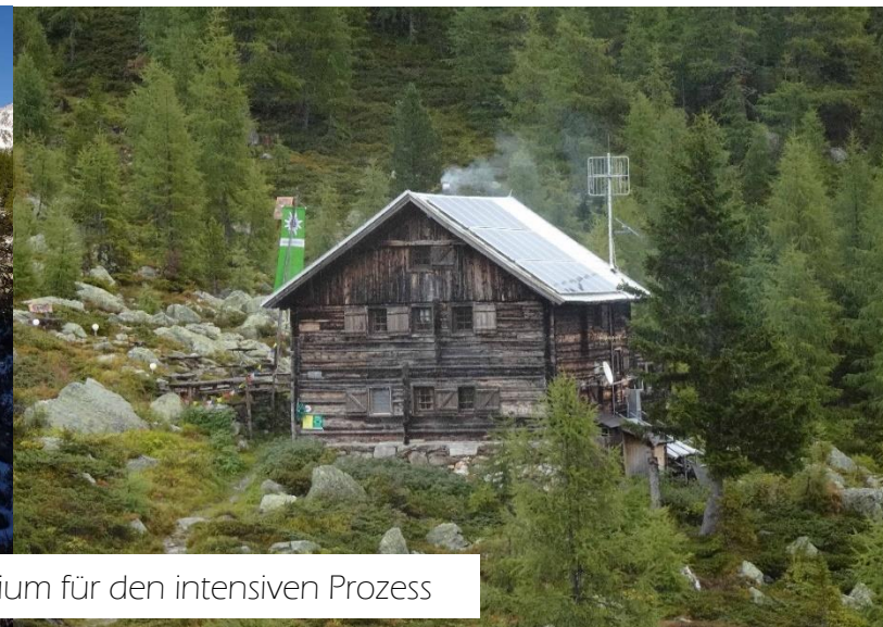
Die Salzkofelhütte – unser Refugium für den intensiven Prozess